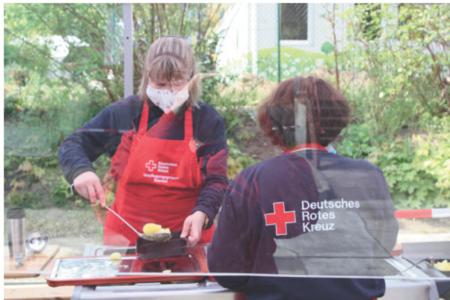
Ehrenamtliche verteilen am 2. Mai warmes Mittagessen bei der Tafel in Stendal

DRK Kreisverband liefert mit Unterstützung von „Aktion Mensch“ und zahlreichen freiwilligen Ehrenamtlichen Lebensmittel an Bedürftige, Senioren und Pflegebedürftige bis an die Haustür.