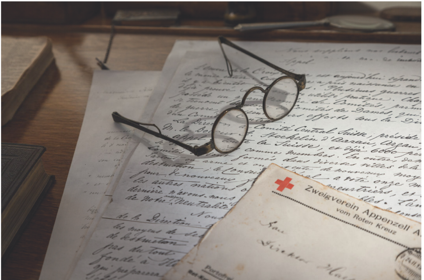
Dunant's Brille und Brief auf seinem Schreibtisch im heutigen Henry-Dunant-Museum in Heiden.

In dieser und den folgenden Ausgaben werden wir uns je einer Station aus dem Leben von Henry Dunant, Gründer des Roten Kreuzes, widmen. Seine Visionen sind bis heute Grundpfeiler unserer täglichen Arbeit. Henry Dunant zog sich nach seiner Rückkehr aus Castiglione in die Abgeschiedenheit zurück. Er suchte anschließend Unterstützer für seine wirtschaftlichen Unternehmungen und idealistischen Visionen.