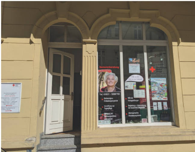
Außenansicht der Seniorenberatung, Frommhagenstraße 21, Stendal

Angehörige und Pflegebedürftige erhalten kostenfrei umfangreiche Beratung rund ums Thema Pflege.